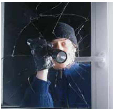
Einbrüche gibt es vor allem in der dunklen Jahreszeit